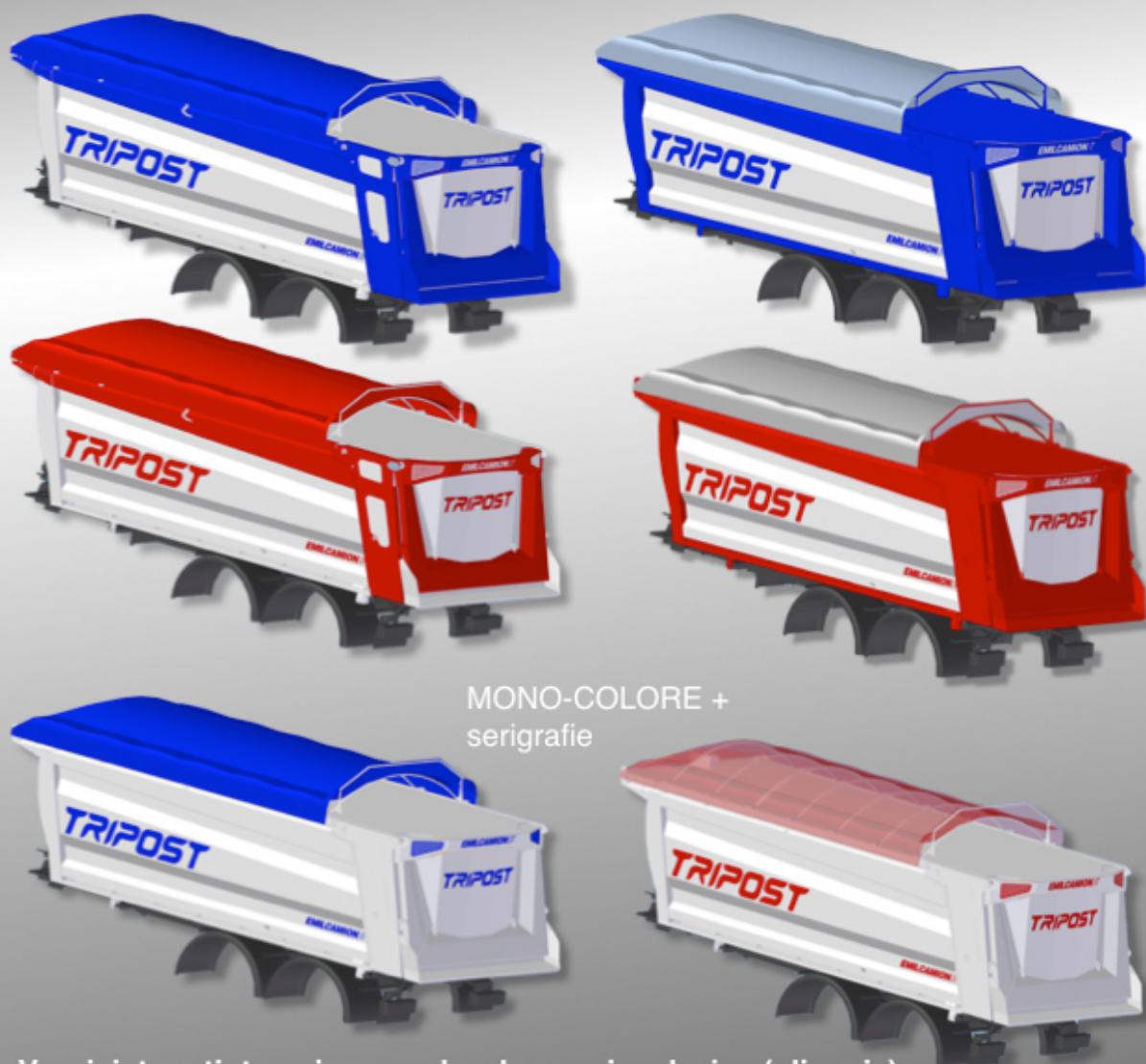
MONO-COLORE + serigrafie