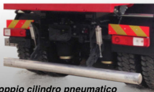
Doppio cilindro pneumatico